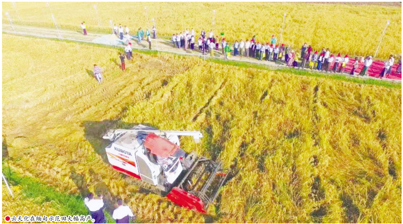
●云天化在缅甸示范田大幅高产。

境物流、供应链金融为支撑,整合肥料产品供应链、农产品供应链、能源化学品供应链,形成集商贸、物流、金融、大数据于一体的全球供应链平台,服务于国内外肥料产业生态圈。