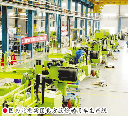
图为北重集团北方股份矿用生产线

对标世界一流管理提升行动是国务院国资委贯彻落实习近平总书记重要指示批示精神的重大部署,也是国企改革三年行动的题中之义。近年来,北重集团深入贯彻落实集团部署,扎实推进对标提升行动,国企改革三年行动,坚持在党和国家战略大局中找定位、强担当、做贡献,在重大任务中挑重担、在关键时刻冲在前、在重要项目中打头阵,为国家争光、为集团公司解忧,以实实在在的工作绩效履职尽责彰显央企担当。中国核工业集团某项目,是我国核电的重大战略项目,项目用某型号不锈钢技术指标达到世界顶级要求。这个项目国内相关厂家无法攻克,项目单位辗转找到北重集团,把最后的希望寄托在了北重集团。