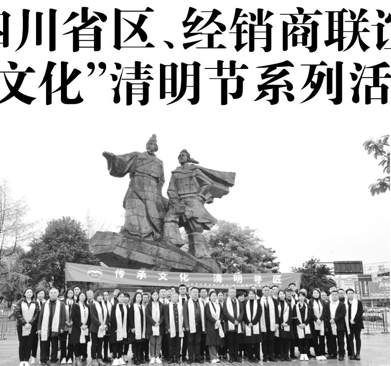
“传承文化 清明寻匠”活动上合影