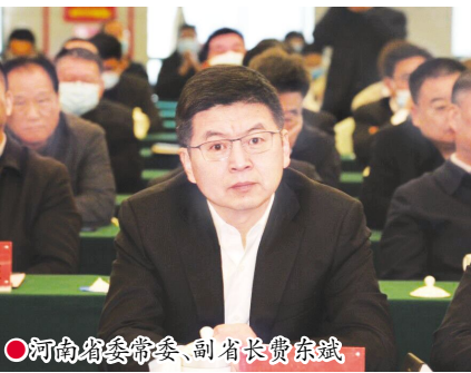
●河南省委常委、副省长费东斌