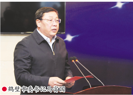
●鹤壁市委书记马富国