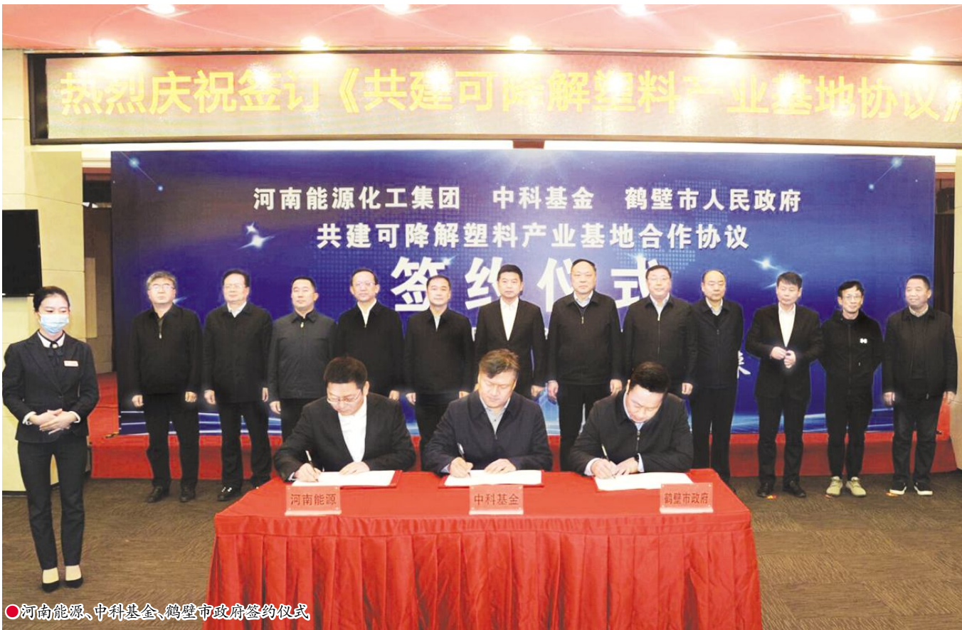
●河南能源、中科基金、鹤壁市政府签约仪式