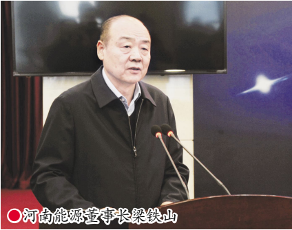
●河南能源董事长梁铁山