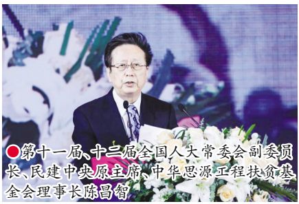
●第十一届、十三届全国人大常委会副委员长、民建中央原主席、中华思源工程扶贫基金会理事长陈昌智

回顾2021这一年，尽管全球仍未远离疫情的影响，中国的疫情防控却卓有成效，表现出较好的经济复苏态势，在全球主要经济体中保持领先，在整个“十四五”时期的高质量发展打下了坚实基础。在这样的背景下，在科技、经济、文化、体育等多个领域，涌现出了一批杰出