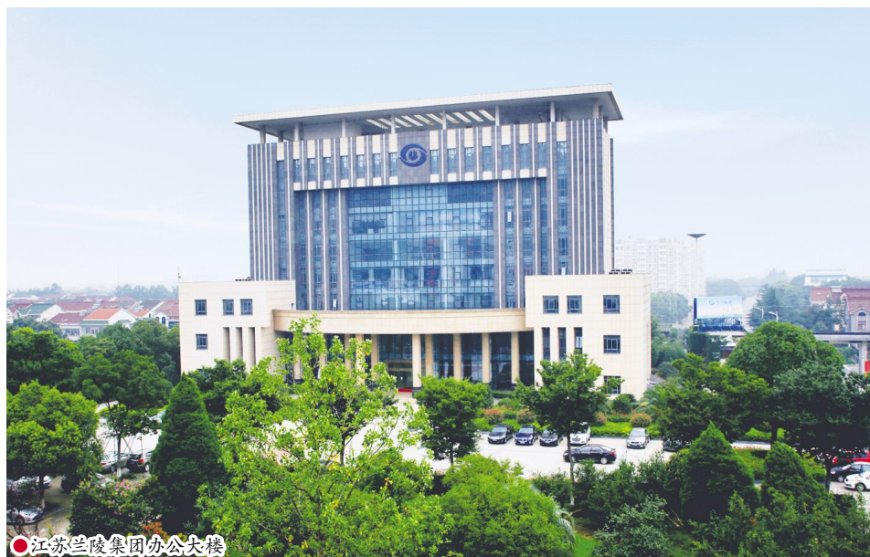
江苏兰陵集团办公大楼

通过集聚资源助推创新研发活动,形成长期带动效益。高度重视并加快推进博士后工作站合作导师博士后团队进站步伐,清晰确立科研课题和研究方向,推动新技术创新应用,加速创新成果产业化转化,并充分发挥创新集群的知识溢出效应和前瞻性的科研视角,研发高