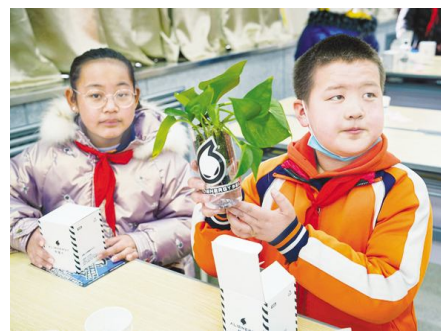
●在外星人充电小课堂上,孩子们用喝完水的塑料空瓶制作了盆栽花盆。