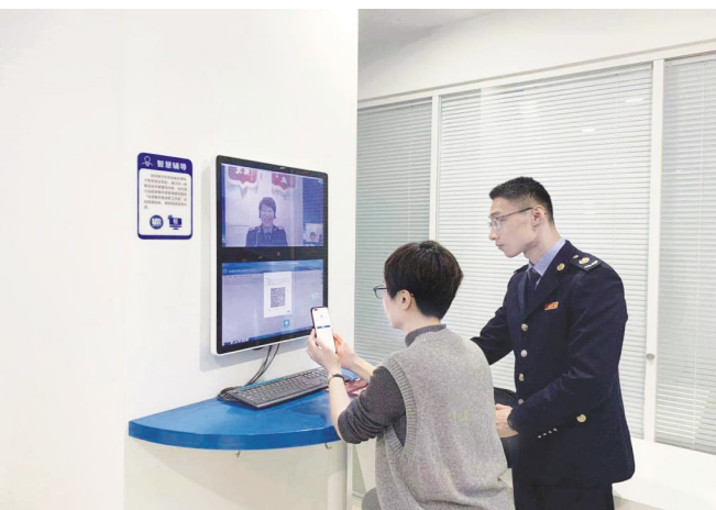
●上海首个“智慧税务社会共治点”

历经近一年的筹划建设,静安区税务局协多方共治之力,在市北高新园区政企通服务中心构建形成了以政务服务为核心,打通服务园区纳税人及缴费人“最后一公里”的“智慧税务社会共治点”。