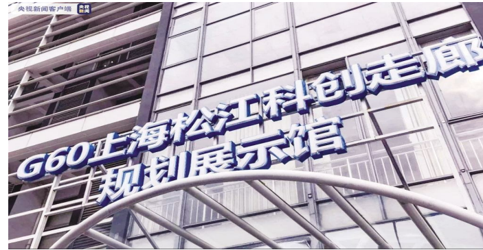
●G60上海松江科创新走廊规划展示馆

该共治点占地500平米,可同时容纳近百人,集成了纳税申报、涉税受理、发票领用、纳税咨询、宣传培训等常用纳税服务功能,有效解决了园区及其周边近4平方公里,3500余户企业纳税人的办税问题。自2021年4月1日市北高新园区社会共治点正式运行以来,共治点已接待218批次309家1304人次的税务机关及企业参观,提供业务办理及咨询服务1416户次,直播培训3379人次。体验者普遍表示,共治点不仅为园区企业带来极大便利,更让纳税充满了“智慧感”和“科技感”。