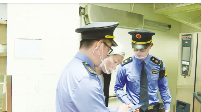
●通过互联网共治平台升级监管新理念