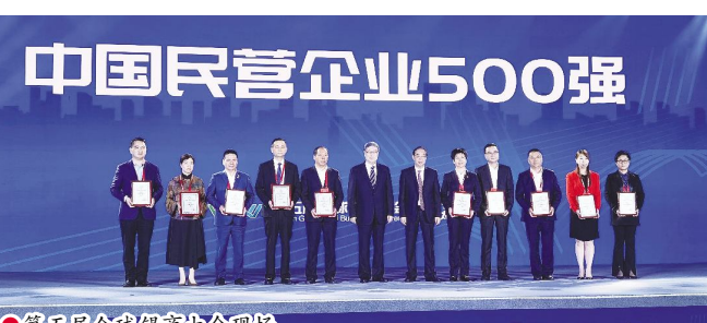
第五届全球锡商大会现场。

设社会主义现代化强国的伟大事业;要永葆赤子之情,争做建设家乡的实干者。关心关注无锡,传播无锡好声音,展示无锡好形象。主动融入无锡发展,积极参与无锡建设,为无锡高质量发展建言、献良策、谋新篇;要秉持奋斗之志,争做创新创业的引领者。始终保持一颗澎湃进取之心,坚守实业、聚焦主业、做强产业,勇于开拓,善于创造,干在实处、走在前列,以勇争第一、敢创唯一成就荣耀,以基