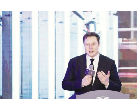
2020年1月7日,在特斯拉上海超级工厂,特斯拉首席执行官马斯克出席中国制造Model Y项目启动仪式

据了解,《2019年中国城市营商环境指数评价报告》中将我国营商环境指数评价体系的一级指标分为硬环境指数和软环境指数。硬环境指数包括自然环境和基础设施环境2个二级指标;软环境指数包括技术创新环境、人才环境、金融环境、文化环境和生活环境等5个二级指标。中国人民大学财政金融学院副院长、金融与证券研究所副所长赵锡军表示,通常来讲,营商环境主要包括硬环境和软环境两块。其中,很多城市在近几年的硬环境建设上花了很大的力气,取得了很多成绩,基础设施建设方面更是可圈可点,有些城市甚至专门划出新的片区为企业提供办公场所,企业办公条件大幅改善。然而,在基础设施不断完善的同时,一些城市的房价也随之水涨船高。特别是北上广深这些一线城市,高房价带来的最