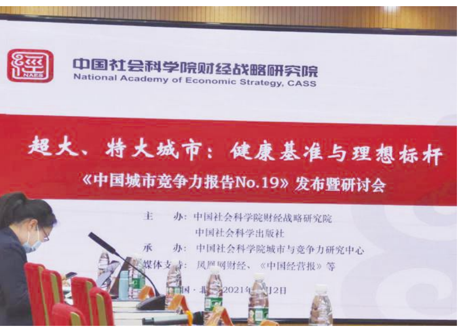
《中国城市竞争力报告No.19》发布暨研讨会现场。

特别是自2019年深入开展“营商环境优化年”以来,市委、市政府把优化营商环境摆在更加突出的位置,作为“一把手工程”打造,市委书记、市长分别担任组长和副组长,创造性地实施“双对标”“指标长”工作机制,坚持