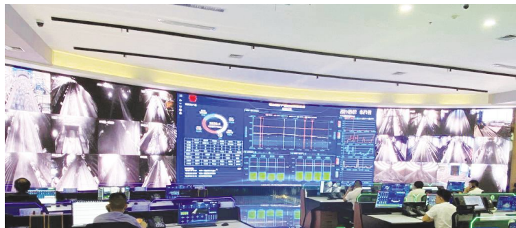
晋能控股煤业集团塔山矿智能化调度办公区。