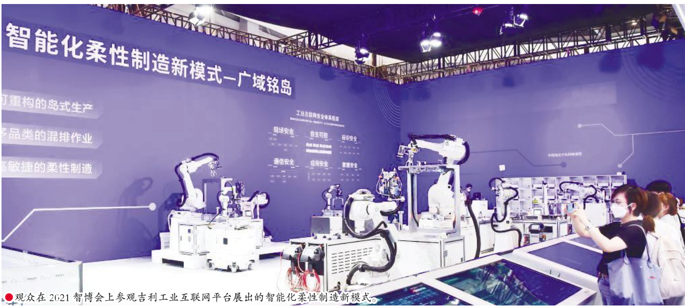
观众在2021智博会上参观吉利工业互联网平台展出的智能化柔性制造新模式。