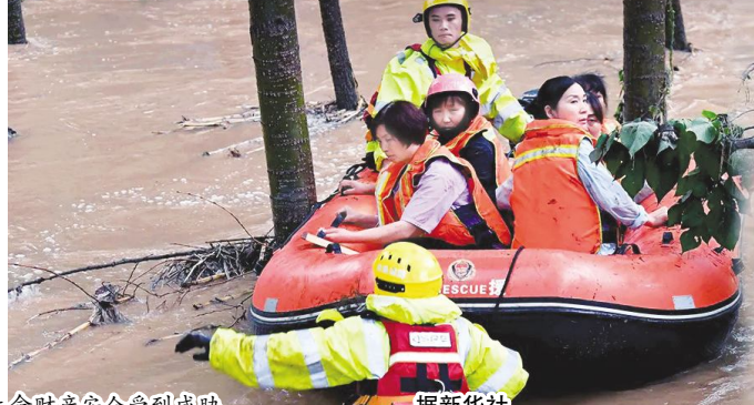
7月16日以来,河南多地遭遇历史罕见持续性强降雨,成千上万群众的生命财产安全受到威胁。