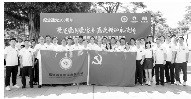
●主题党日活动合影

庆百年华诞的重大时刻,在“两个一百年”奋斗目标历史交汇的关键节点开展党史学习教育的重大意义,明确目标任务,准确把握党史学习教育教育的着力点,做好省、市、县(区)属商会党建工作,广泛动员引导商会、民营经济人士扎实开展党史学习教育,深入开展青年闽商群体理想信念教育;积极发挥商会统战联络员作用,团结好、引导好民营经济人士,尤其是发挥青年闽商群体的优势,凝聚全省“大”非公有制经济人士磅礴力量,助推福建经济又好又快发展。他寄语青年闽商要通过党史学习教育,切实把到建党百年服务社会发展的目的,确保“十四五”开好局、起好步,做出非公有制企业应有的贡献,以优异成绩迎接和庆祝建党100周年。