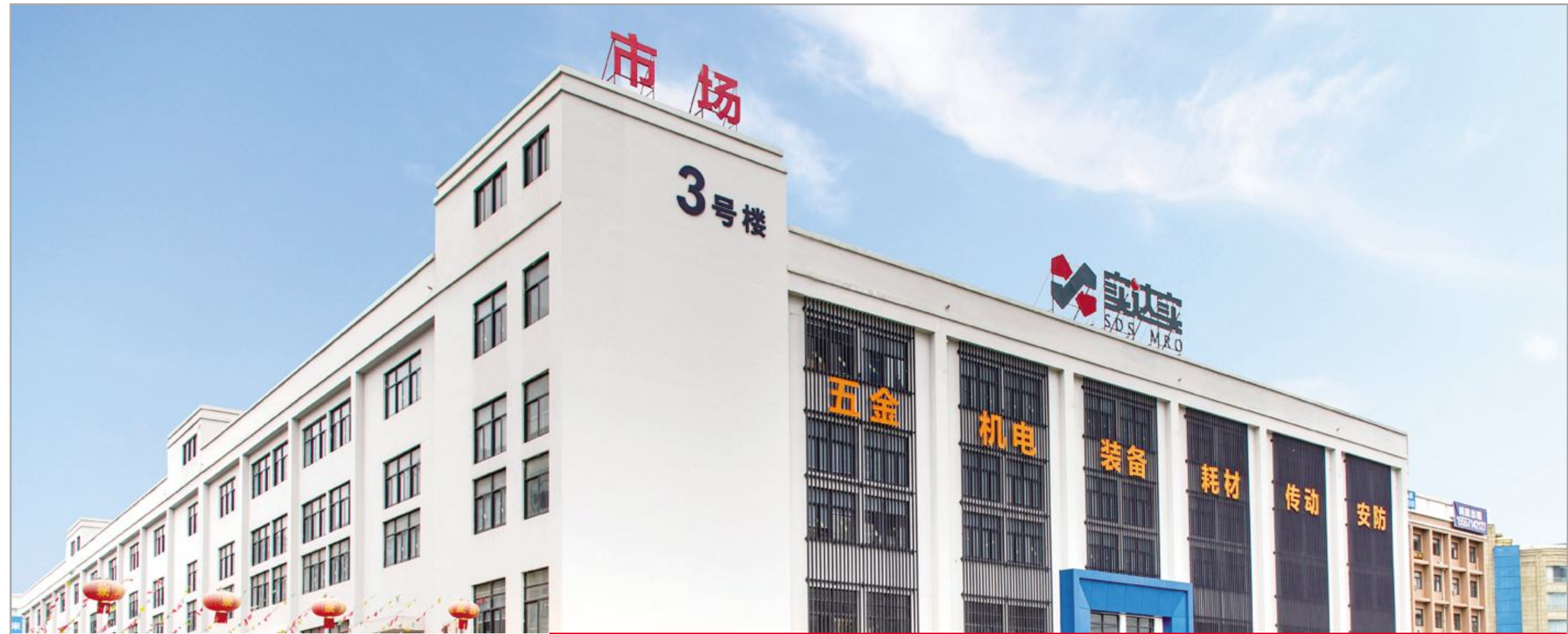
●杭州萧东机电市场实达实(杭州)工业购买场外景