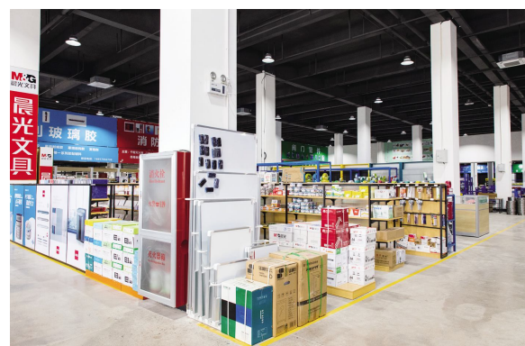
●杭州萧东机电市场实达实(杭州)工业购买展厅