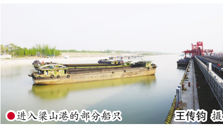
●进入梁山港的部分船只

笃行致远,不忘初心。以质量为导向,做真做实,做强做远,白云边将迎来更加辉煌的明天!(刘思祺 王小波)