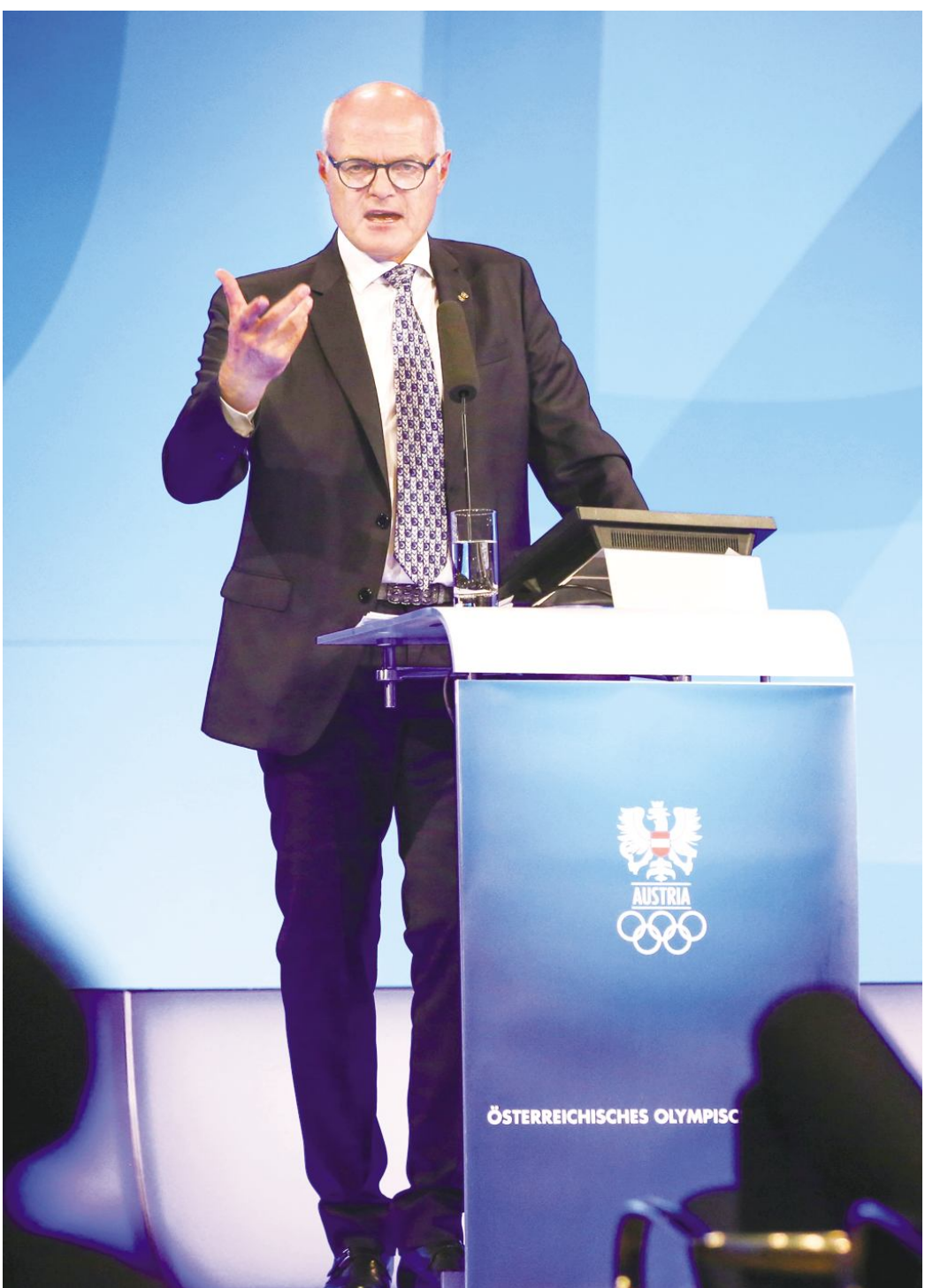
● 卡尔·施多斯 奥地利国家奥委会供图