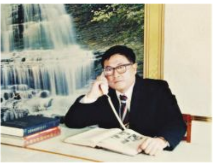
从车间一线工人到企业领头羊、行业领军人物