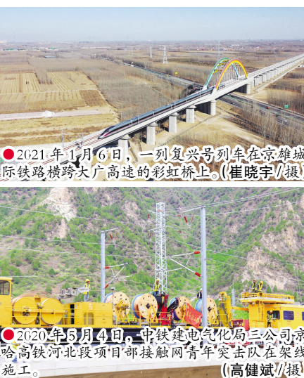
●2021 年 1 月 6 日,一列复兴号列车在京雄城际铁路横跨大广高速的彩虹桥上。