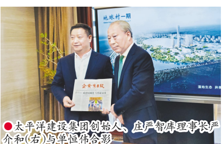
太平洋建设集团创始人、庄严智库理事长严介和(右)与单恒伟合影

太平洋建设集团始建于 1995 年,是一家以基础设施投资、建设与管理为核心产业,拥有国家公路、市政、水利、建筑等多个总承包及若干专业承包一级资质,风景园林工程设计拥有顶级资质的民营企业。在中国城市化、城镇化、城乡一体化的进程中,太平洋建设融资源、智慧、资本于一体,成为中国最大的城市运营商。2019 年 7 月 22 日,2020 年《财富》