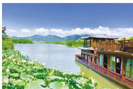
《夏》马晓才 / 摄