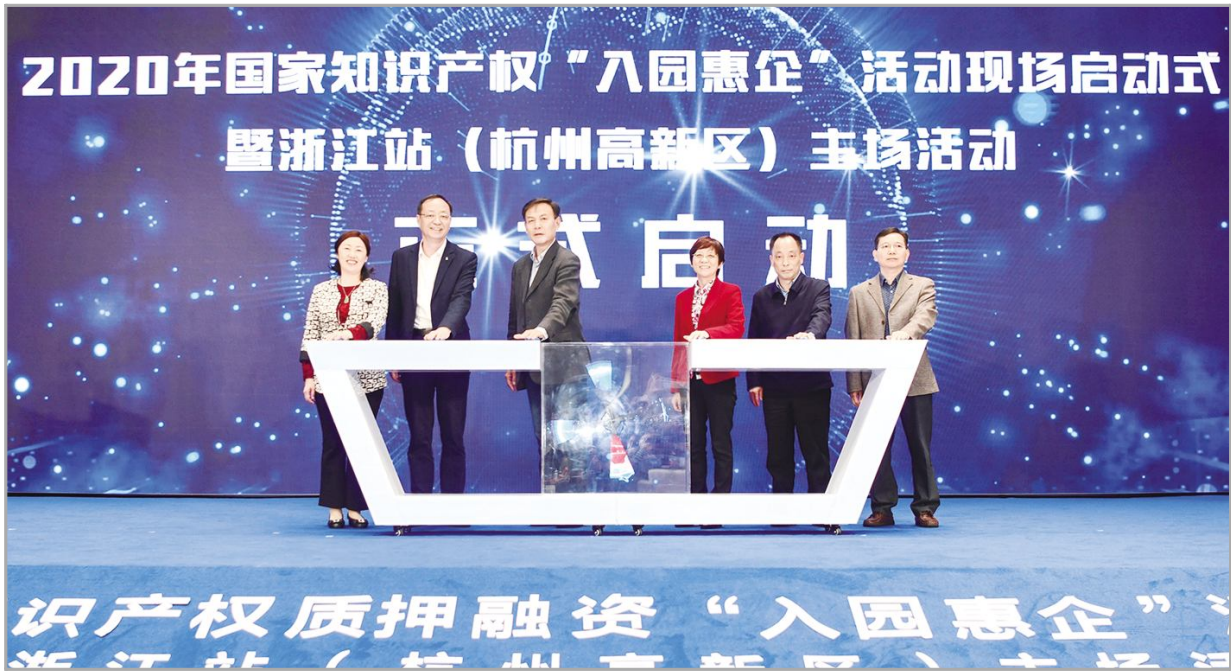
● 国家知识产权质押融资“入园惠企”活动启动仪式

启动仪式上还发布了浙江省完善知识产权质押登记线上办理相关政策以及2020年度国家知识产权质押融资典型案例,举行了浙江省知识产权质押登记服务窗口授牌仪式、杭州市市场监督管理局与杭州高科技融资担保有限公司风险资金池战略合作协