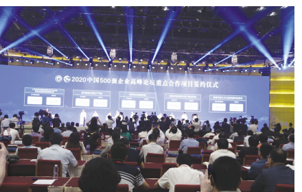
会常务副会长朱宏任主持,河南省省长尹弘同志致欢迎辞,河南省委常委、郑州市委书记徐立毅同志进行郑州市市情介绍,国务院国资委党委书记、主任郝鹏,国家发展和改革委员会副秘书长赵辰昕、工业和信息化部产业政策与法规司司长许科敏致辞;王忠禹会长做了“直面挑战,担当作为,奋力开创大企业发展新局面”的主旨发言。

国家电网友董董事长毛伟明,正威国际董事局主席王文银,绿地集团董事长张玉良,中国建材董事长周育先,联想控股董事长李彦等知名企业家、各地企联、有关行业协会的领导和同志,著名高校、科研院所和中介机构的专家、学者,河南省、郑州市有关方面的领导和新闻界的朋友共有1300多名代表出席了本次高峰论坛。