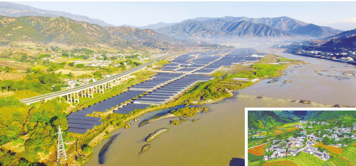
张永忠 本报记者 万鹏飞

德昌县位于四川省西南部,地处安宁河谷腹地,环境优美,宜居宜业,森林覆盖率达69.4%,是全国绿化模范县,有“春秋三百天、四季养生地”之美誉。