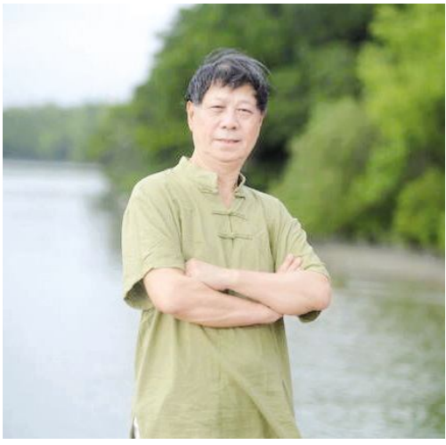
程与天，满族，祖籍辽宁北镇，1950年生于沈阳，著名书法家、篆刻家。现为中国书法家协会会员、中国书法促进会副会长、北京世界华人文化院顾问、海南三立画院院长、北京东方书画院副院长、人民日报神州书画院特邀书画师、协和函授学院艺术教授、中华诗词学会会员、英国剑桥