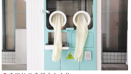
海润核酸采样安全方舱

据了解，海润核酸采样安全方舱自面世以来，已在北京、上海、重庆、四川、山东、广东等多地的一线抗疫医院及社区卫生服务中投入使用，得到了众多医务工作者的高度认可并收到良好的社会反响。