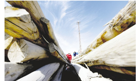
岗位人员梳理库存物资。

院院协商确定，将闲置的带行吊封闭库一座、半封闭库一座和部分露天仓储区域出租给了该企业，并提供装卸作业服务，年创收约30万元。