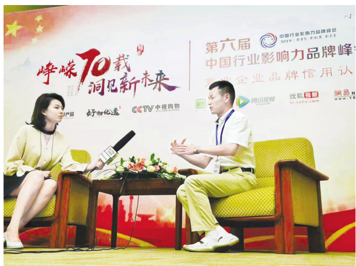
●百强参加第六届中国行业影响力品牌峰会