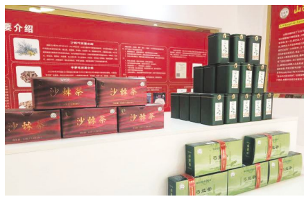
● 宋家沟沙棘产业园已有沙棘复合浓缩浆、沙棘复方茶、沙棘复方功能茶饮等产品。

建设了沙棘产业园,去年 8 月正式投产。今年 3 月 20 日,“山西药茶”省级区域公用品牌发布。山西省委书记、省长联手为这一品牌站台,力求把“山西药茶”打造成中国第七大茶系。崞岚县的山沙棘产业迎来了发展机