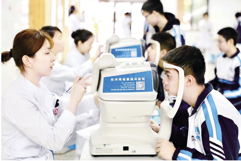
●明视康公益活动走进校园