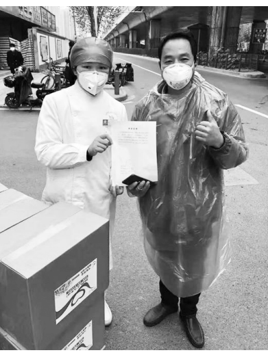
●图为伽力森主食(江苏)有限公司工作人员现场向武汉一线医务工作者捐赠物资的现场。