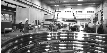
●瓦轴集团风电轴承生产线。