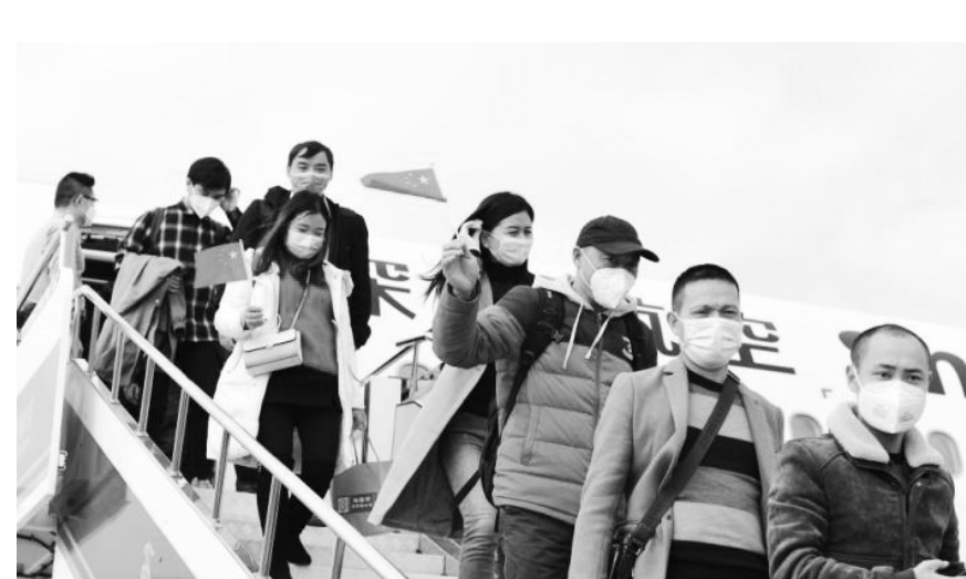
●成都返岗人员乘坐深航ZH9146包机飞抵深圳。