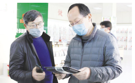
● 李明海副州长(右)和王志荣董事长(左)交流安多牧场牦牛肉休闲产品升级和销售情况

“安多集团将会科学组织生产经营,积极应对疫情带来的新形势、新变化。”王志荣说,这次疫情虽然给中国经济和社会发展带来了挑战,但我们深信在党和政府的坚强领导下,全国人民齐心协力,一定能打赢这场新冠肺炎疫情阻击战,正如习近平总书记接受俄罗