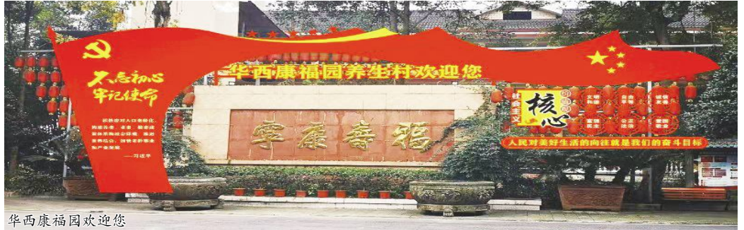
华西康福园欢迎您