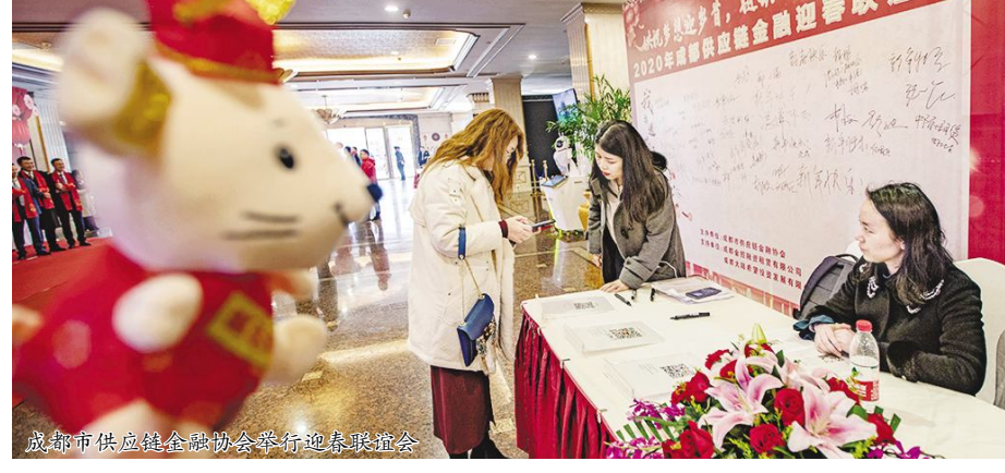
成都市供应链金融协会举行迎春联谊会

接下来,将乘着政策的东风,以“严谨务实、开拓进取、自律创新、合作共赢”的办会理念,将协会打造成为行业协同、产业共赢、具有较高专业化水准和市场影响力,助力实体经济发展的服务型行业协会;将积极履行自身使命职责,发挥专业、信息、人才、机制等优势,努力将协会建设成为政府与市场、社会之间的重要桥梁纽带;为会员办实事、为行业谋发展、为经济添活力、为社会担责任,助力成都市供应链金融发展启航。