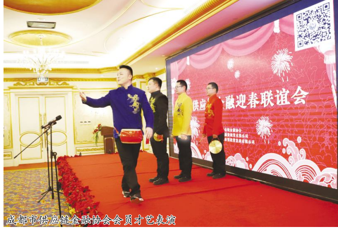
成都市供应链金融协会会员才艺表演