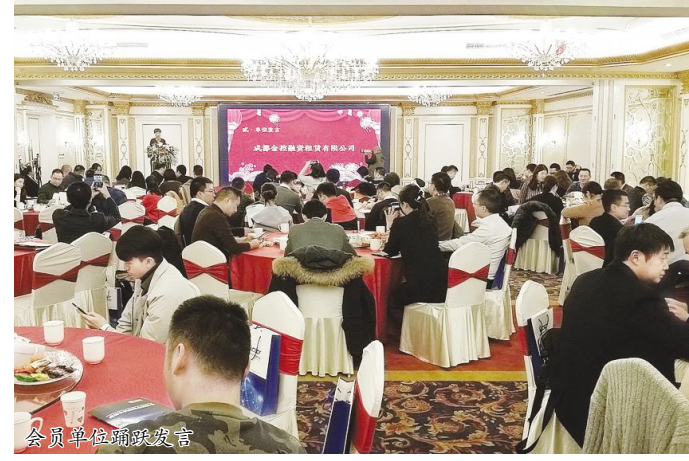
会员单位踊跃发言