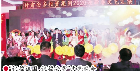
“祝福祖国,祝福安多”文艺晚会