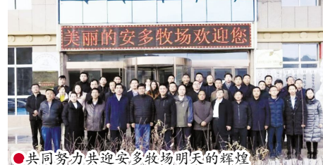
共同努力共迎安多牧场明天的辉煌

无疑,企业只有携手更多志同道合的人,才能在激烈的市场竞争中生存、发展、壮大。会上同时表彰了优秀客户代表。安多集团还与甘南州酥油灯酒店、甘肃陇萃堂养生保健食品有限公司、云南瑞义源食品有限公司等重点客户分别举行了签约仪式。