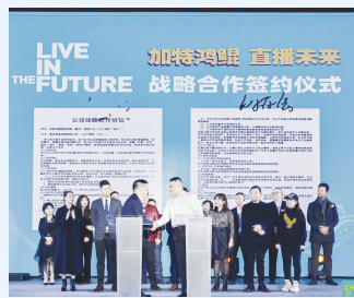
●战略合作签约仪式