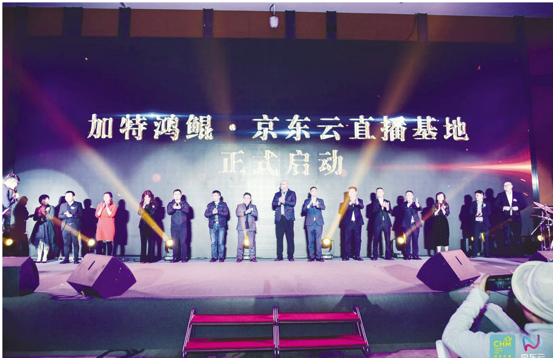
●加特鸿鯤·京东云直播基地启动现场

通过直播基地与当地产业彼此赋能,相互依托,带动当地产业更全面发展,形成更多业态的良性循环。全新的产业链和运营模式,将更有力地孵化品牌,拉动经济,还将充分带动当地就业。