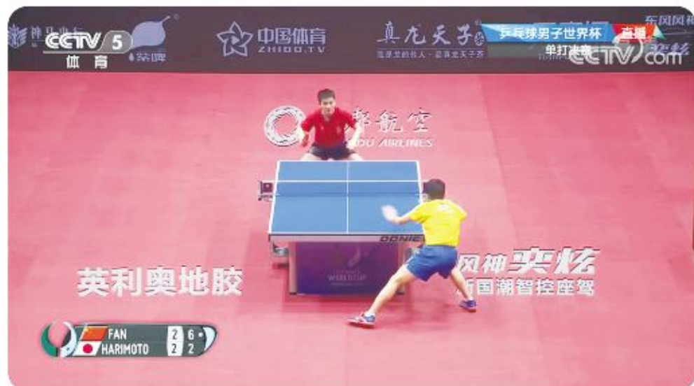
CCTV5直播 2019 国际乒联世界杯世界冠军樊振东与日本选手张本智和的赛事