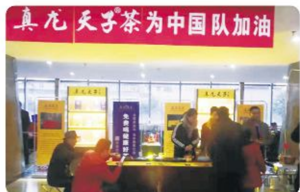
真龙天子茶为观看赛事的球迷奉品“龙的传人”大红袍