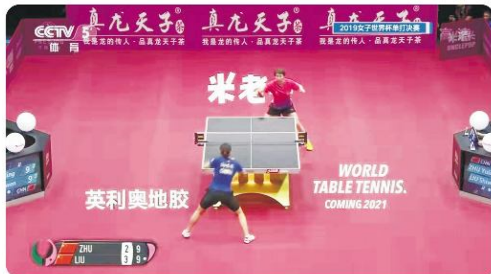
CCTV5直播2019 国际乒联世界杯2位世界冠军朱雨玲和刘诗雯决赛对决