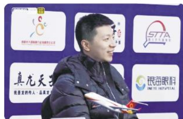
2019国际乒联新闻发布会上马龙答记者问