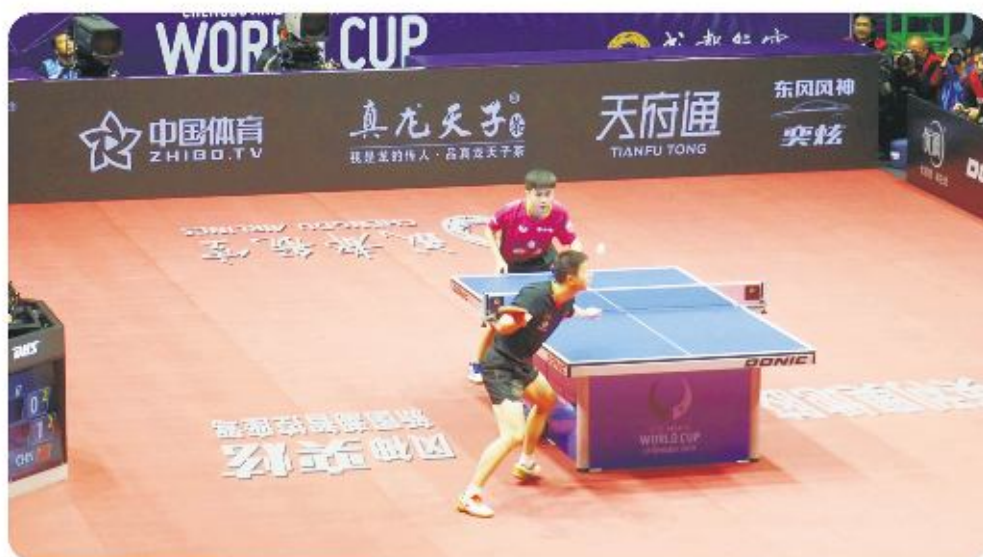
CCTV5直播 2019 国际乒联世界杯奥运冠军马龙与台湾选手的赛事