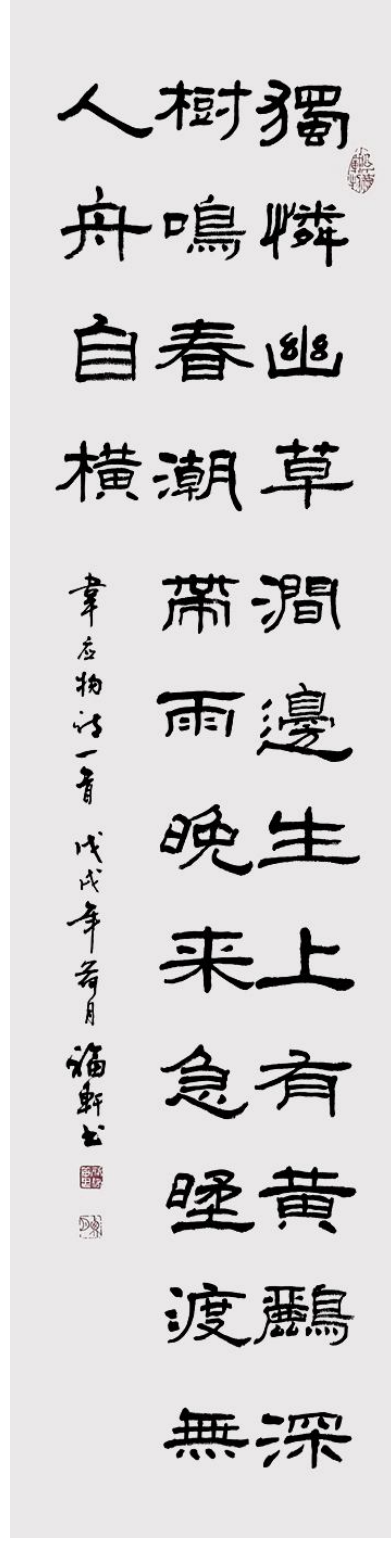
蔡福轩作品 韦应物诗词《滁州西涧》