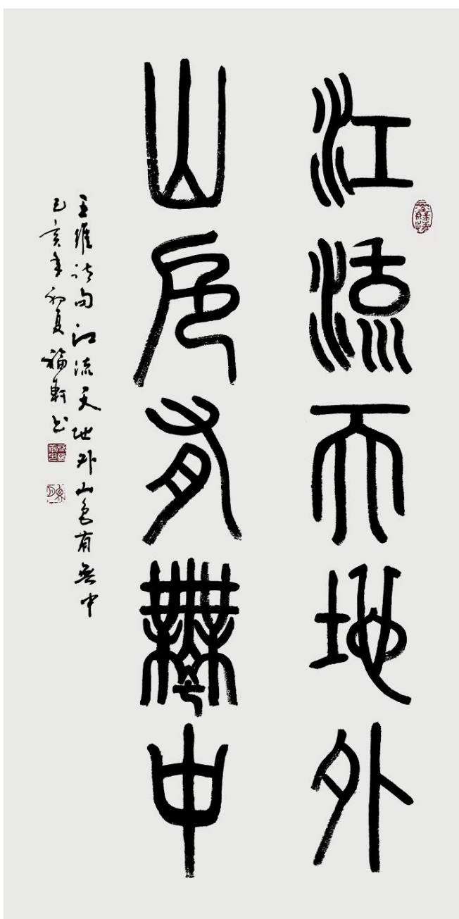
蔡福轩作品《江流天地外 山色有无中》