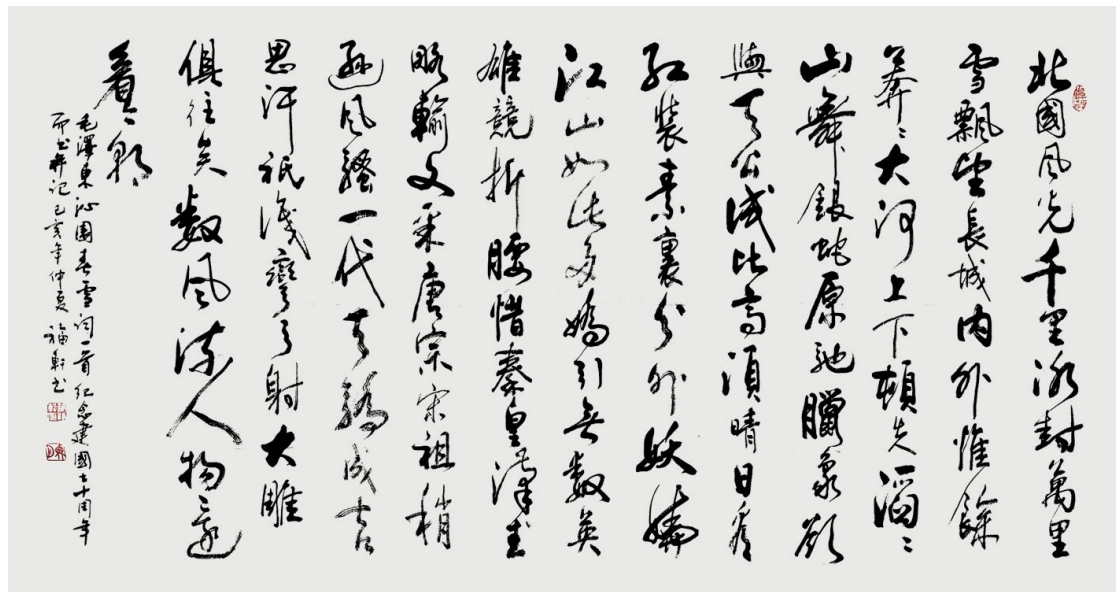
蔡福轩作品 毛泽东诗词《沁园春·雪》