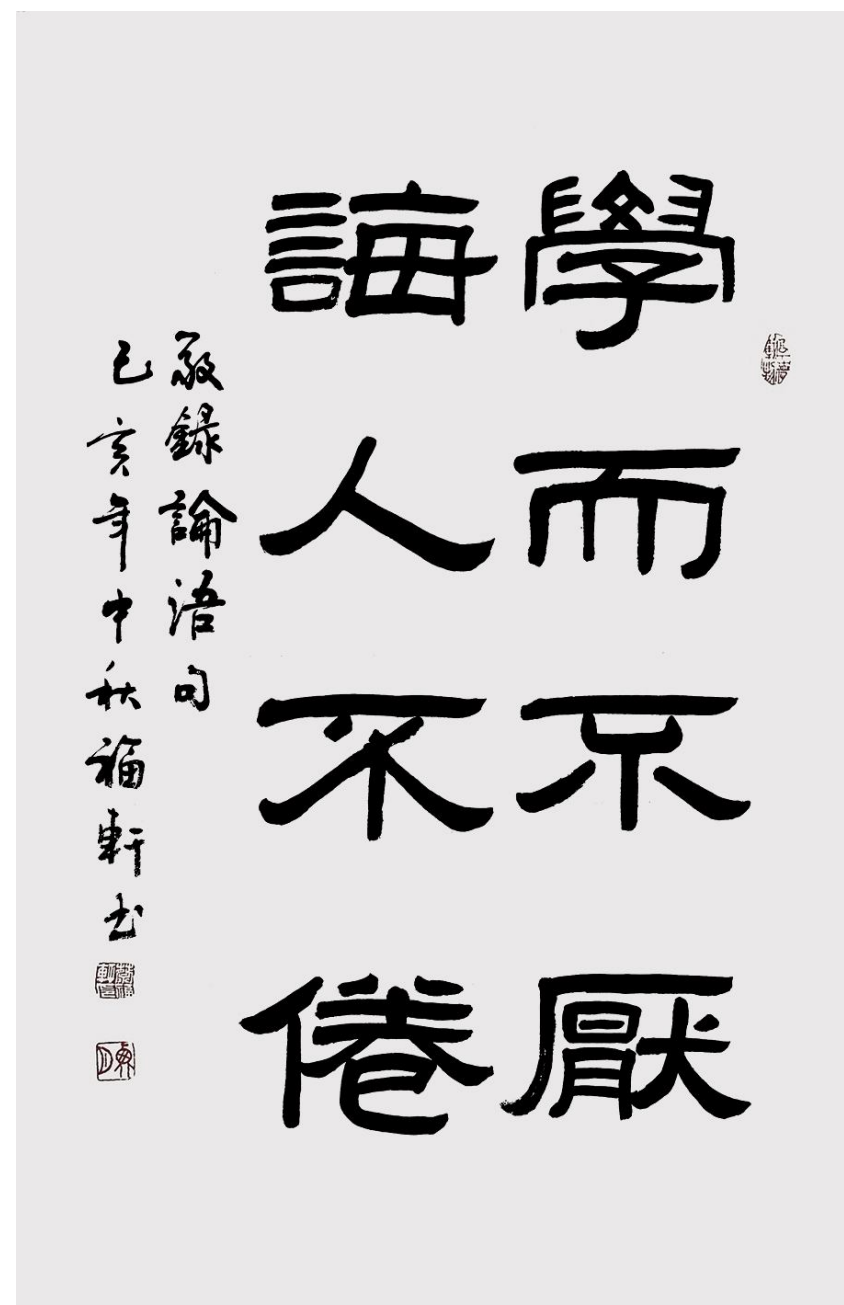
蔡福轩作品《学而不厌 诲人不倦》