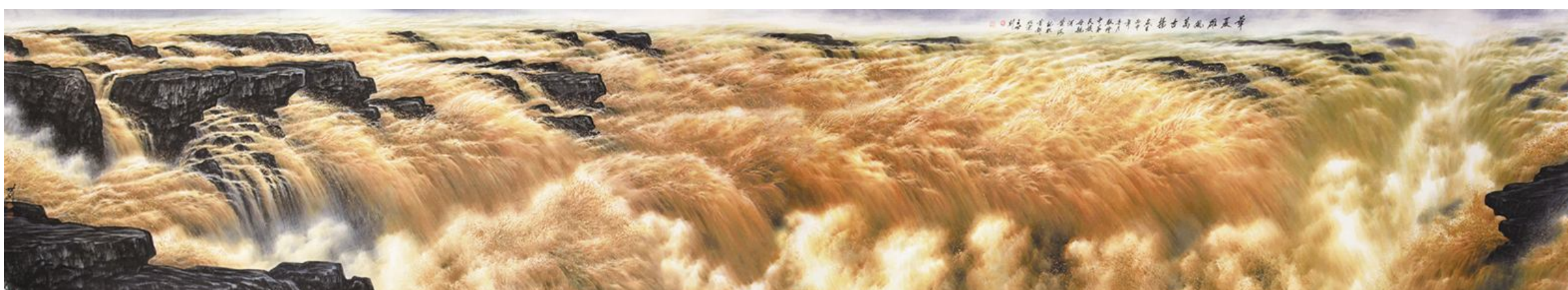
《华夏雄风万古扬》规格:100×550cm