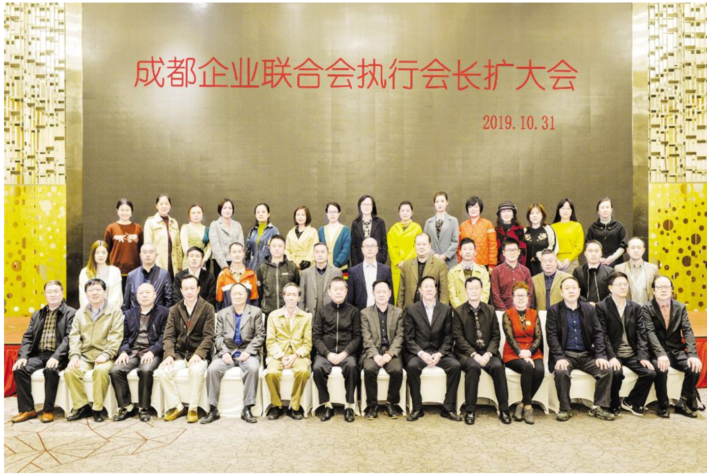
成都企业联合会执行会长扩大会议