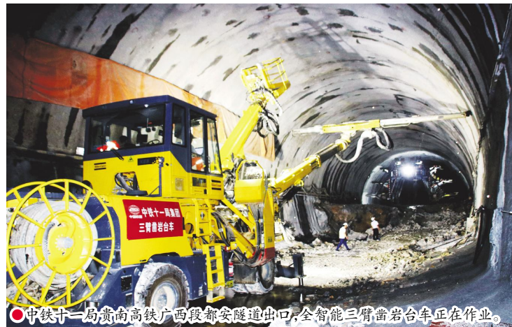
中铁十一局贵南高铁广西段都安隧道出口,全智能三臂凿岩台车正在作业。

在贵南高铁,流行这样一种说法:要看隧道机械化、标准化、信息化和智能化施工(以下简称“四化”),就去广西都安瑶族自治县境内中铁十一局负责施工的都安隧道出口。都安隧道出口的“四化”施工,不单吸引了全线和广西境内一些在建高速公路建设者的目光,中国国家铁路集团公司(原中国铁路总公司)有关领导同样十分关注都安隧道“四化”施工的一系列探索实践。