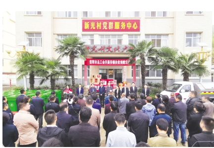
办授予劳模助力脱贫攻坚“十面红旗单位”荣誉称号。

此次捐赠,羚锐集团为苏河新光村捐赠了小型三轮垃圾清运车1台、超大型垃圾桶60个及10件香菇酱,价值3万余元,助力苏河乡村振兴,建设美丽苏河、魅力苏河。