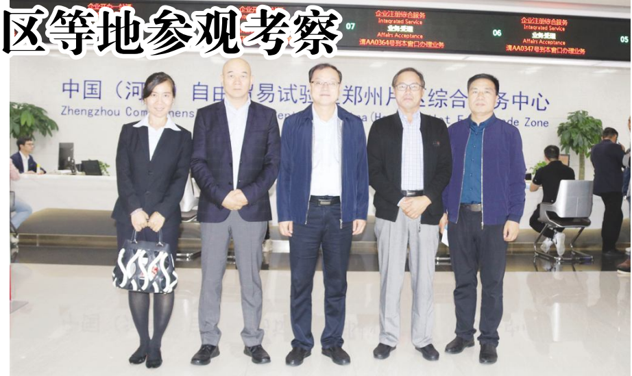
合服务区四个功能分区。中心位于全国铁路公路网最大交汇处、全国重要物流节点的郑州经济技术开发区内,是中原经济区重要国际采购、分拨和配送中心。

河南保税物流中心成立于2010年1月7日,是河南省重要的外向型经济服务平台。中心占地55万平方米,总投资20亿元,分为海关运行区、特色物流交易区、口岸作业区、综