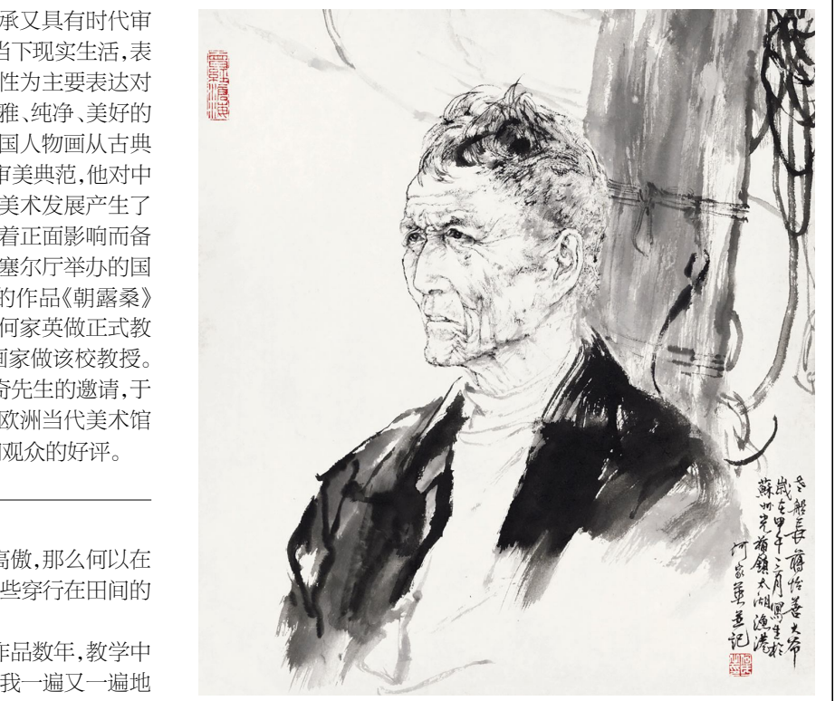
《太湖渔港船长蒋怡善》45×40cm

之间,建构起一个既有传统文化传承又具有时代审美特征的新型工笔画语言。他关注当下现实生活,表现当代人的心灵诉求,他以当下女性为主要表达对象,以创造性的写实手法,表达出优雅、纯净、美好的高尚境界。在新的语境下完成了中国人物画从古典到现代形态的转型。他创造了一个审美典范,他对中国当代文化建构和对30年来的中国美术发展产生了积极的重大影响。在国际上也产生着正面影响而备受瞩目。2012年在法国卢浮宫卡鲁塞尔厅举办的国际当代美术展(法国沙龙展)上,他的作品《朝露桑》荣获金奖。日本东京艺术大学诚聘何家英做正式教授,这是一百年来首次聘任中国的画家做该校教授。给中国人争得了荣誉。受小萨马兰奇先生的邀请,于2013年11月21日在西班牙巴塞罗那欧洲当代美术馆举办何家英画展,得到西班牙业界和观众的好评。