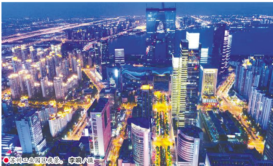
◎苏州工业园区夜景。