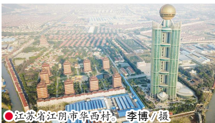
◎江苏省江阴市华西村。