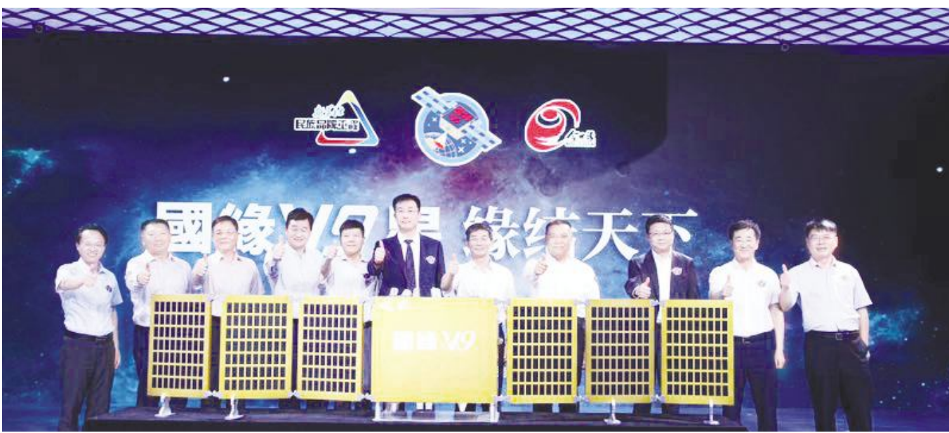
● 现场嘉宾与卫星模型合影留念

新华社民族品牌工程将为企业提供空、天、路一体化的品牌传播服务,实现全媒体、全渠道、全世界传播。“新华社民族品牌工程”是响应品牌强国战略的综合服务体系,旨在