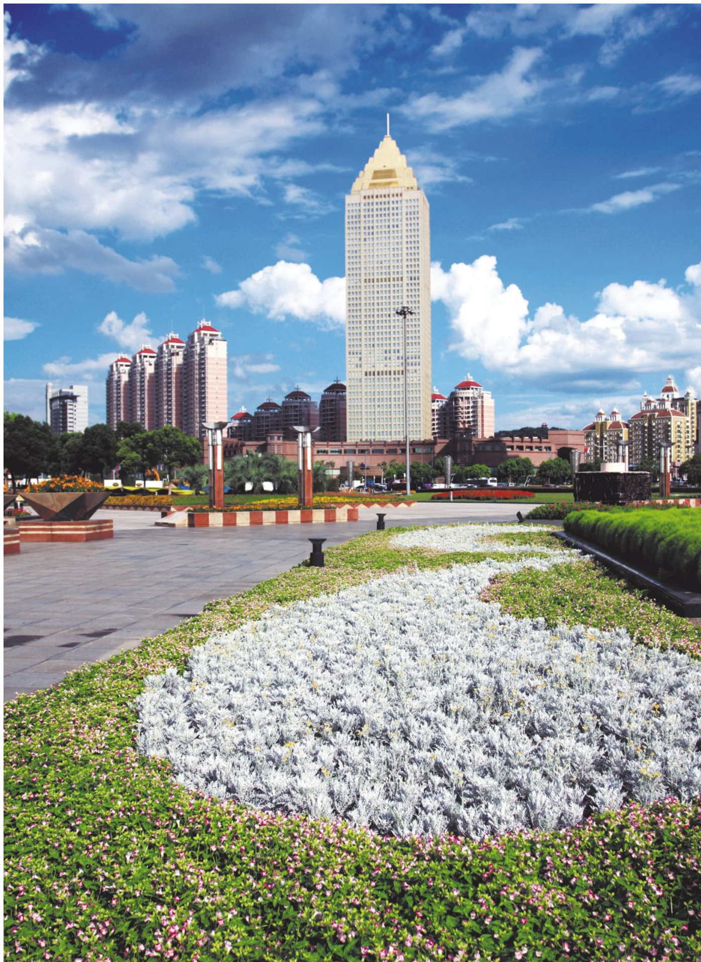
●杭州开元名都大酒店