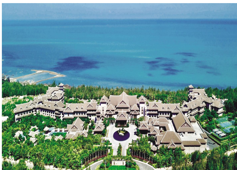
●海南棋子湾开元度假村