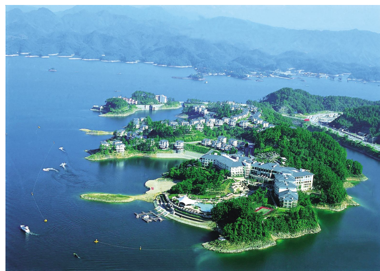
●开元千岛湖度假村