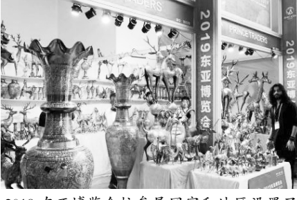
2019 东亚博览会按参展国家和地区设置了波兰、斯里兰卡、印度、意大利、捷克、比利时、希腊、俄罗斯等特装展。

时值中捷建交 70 周年。中欧文化交流协会秘书长李亚楠携捷克水晶、啤酒、葡萄酒首次参展东亚博览会。他表示,捷克的水晶等产