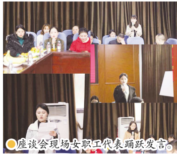
座谈会现场女职工代表踊跃发言

座谈会上,公司领导与女职工代表们围坐在一起,大家在一派轻松、融洽的气氛中畅所欲言。“要听媳妇的话,跟着媳妇走,工资卡交我手”,公司领导幽默风趣地为大家“出谋划策”,回家让老公做家务,幸福地当“女王”。