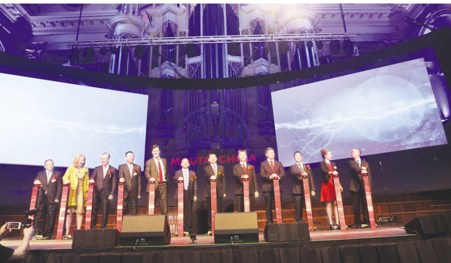
● 2018 年 5 月 30 日,出席活动的领导与嘉宾共同启动 2018 文化茅台走进澳洲品牌推介活动