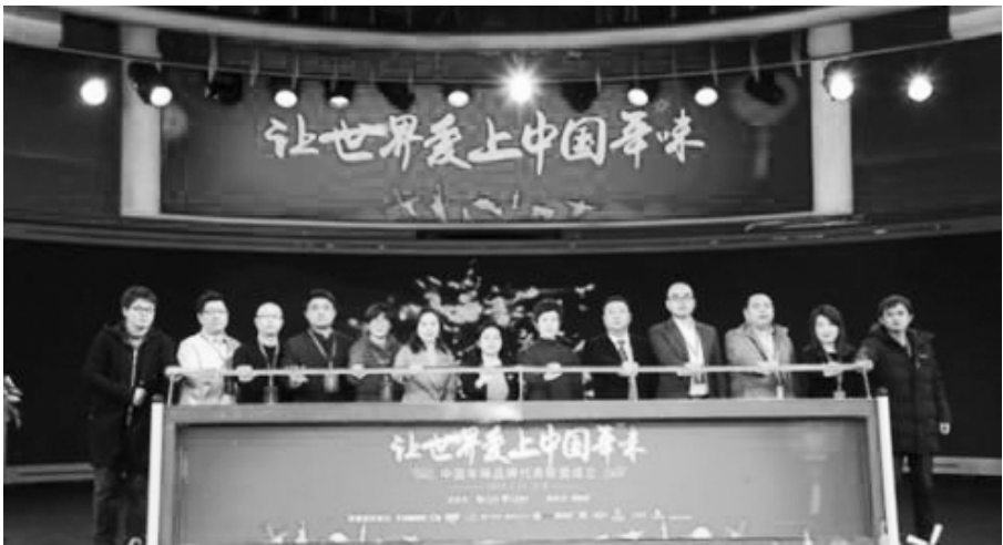
● 中国年味品牌代表联盟发布会现场

北宋末年创办的嵊城周氏渊源堂义塾(剡溪书院前身),名声远播。王十朋曾于 1148 年、1153 年二度入剡担任师席,教授生徒,开一代学风,为剡溪教育事业做出了重要