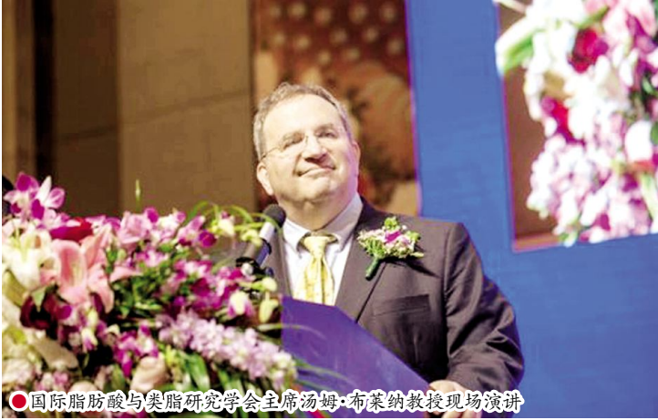
●国际脂肪酸与类脂研究学会主席汤姆·波西曼教授现场演讲