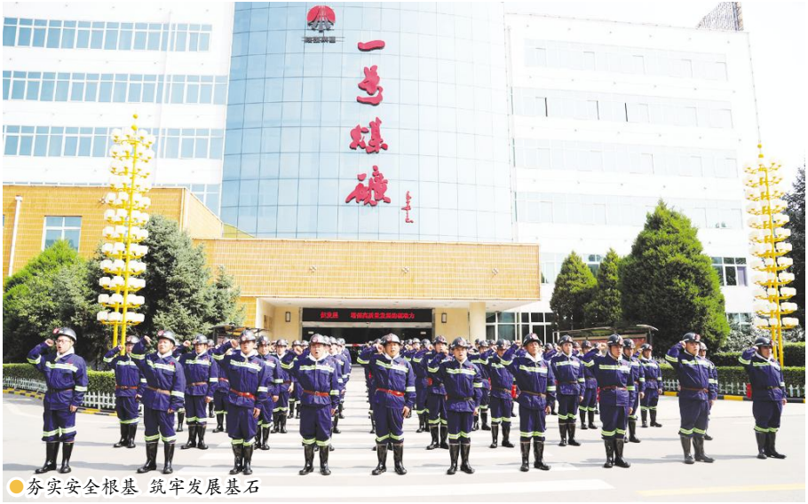
●夯实安全根基 筑牢发展基石