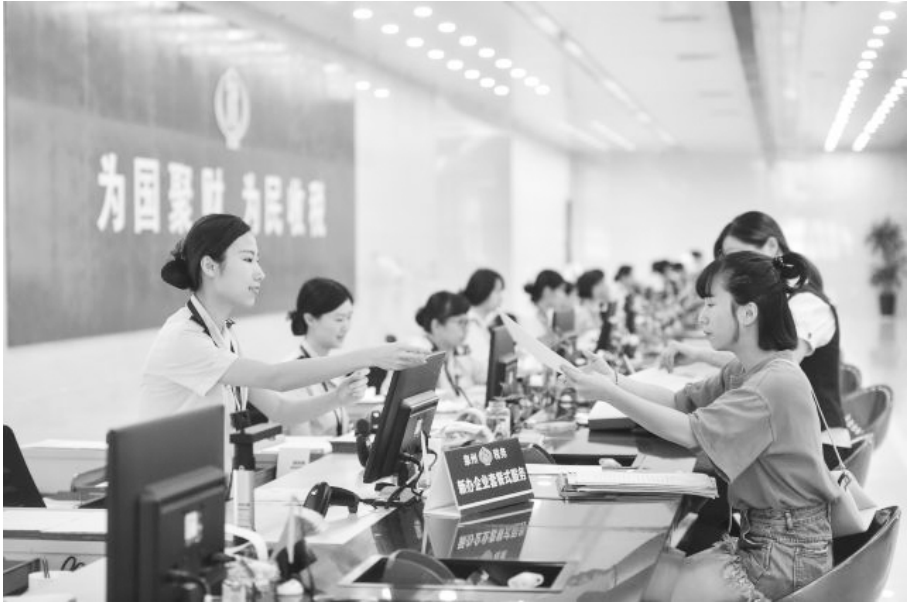
●国家税务总局泉州市税务局丰泽街办税服务厅的工作人员在新办企业服务窗口为纳税人办理业务。