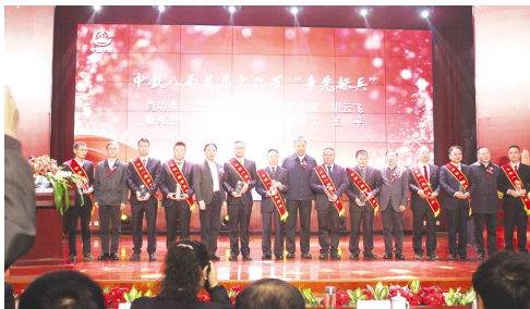
●“争先标兵”表彰颁奖