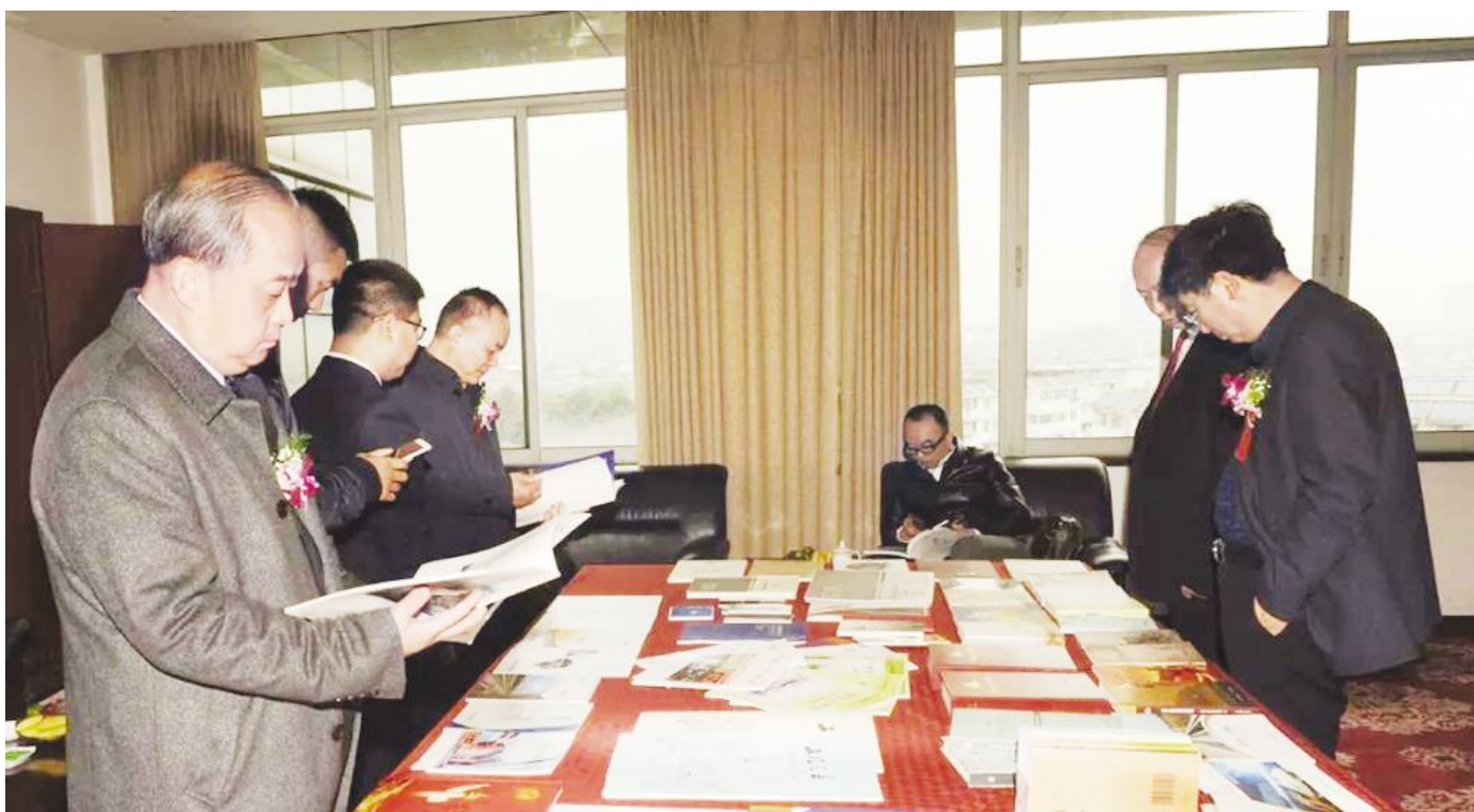
●“争先企业文化”成果展示。

自2003年底重组成立以来,通过近15年来企业文化建设的探索与实践,中铁八局形成了具有一定影响力和竞争力的特色企业文化,中铁八局也先后荣获全国企业