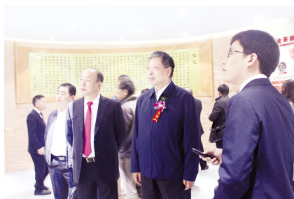
●领导和嘉宾们在新展厅中参观