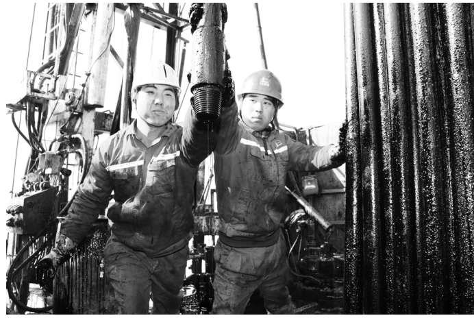
● 施工工人起下注水管柱,实施高压搭桥工艺。

目前,在底水源头通过“抽水引流”的方式降低井区含水,治理四个单元日增油57吨,含水下降29%,取得较好效果;依托最新地质研究成果“断溶体”理论调整并组水驱,建立空间立体结构井网,精准驱替每个关联缝洞体,分段建水驱,层层提效果,实施10个井组,新增可采储量10.3万吨;通过“三线合一”储层参数的量化技术,指导酸化增注增采9井次,增油1.2万吨,新增SEC储量4.5万