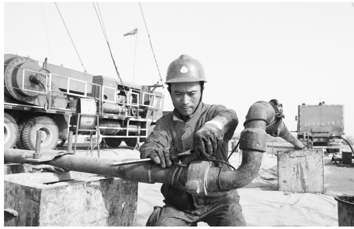
● 链接高压注水管线,实施高压水钻工艺。

全厂围绕“降成本、调结构、补短板、消瓶颈、抓创新、稳增长”十八方针,以提高采收率为目的,引进和研发各类新型工艺技术,解决工程技术不完善与油藏需求的矛盾。针对